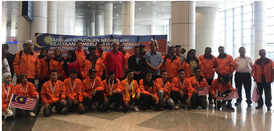
Kontinjen Malaysia bergambar kenangan pada Majlis Sambutan Kontinjen Malaysia dari WorldSkills Asia (WSA) Abu Dhabi 2018 di Lapangan Terbang Antarabangsa Kuala Lumpur (KLIA) semalam.